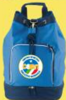
Cod. ZA/SAC SACCA Dimensioni: cm.37x26x55H