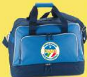
Cod. B001 BORSA Dimensioni: cm.53x30x38H