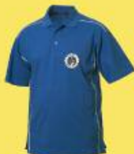
Cod. POLO/U/55 POLO UOMO Taglie: S - XXL