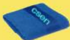
Cod. TEL/PA TELO Dimensioni: 40x100H