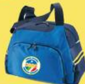
Cod. BO/TRACBORSA Dimensioni: cm.45x19x39H