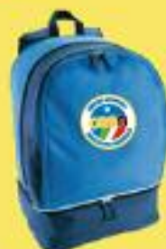
Cod. ZA01 ZAINO Dimensioni: cm.37x26x55H