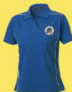
Cod. POLO/DN/55 POLO DONNA Taglie: 36/S - 44/XXL